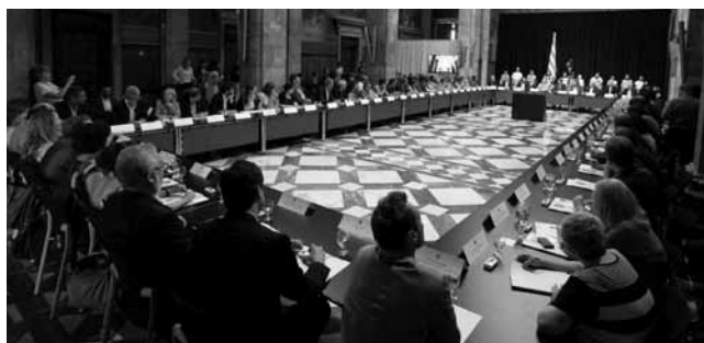
#16. Signatura del Pacte per a la infància a la Generalitat de Catalunya. 2013. Participem dels processos que poden beneficiar el benestar de la ciutadania.