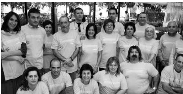
#7. 10è aniversari del CEESC. Dinar de germanor a Girona. 2006