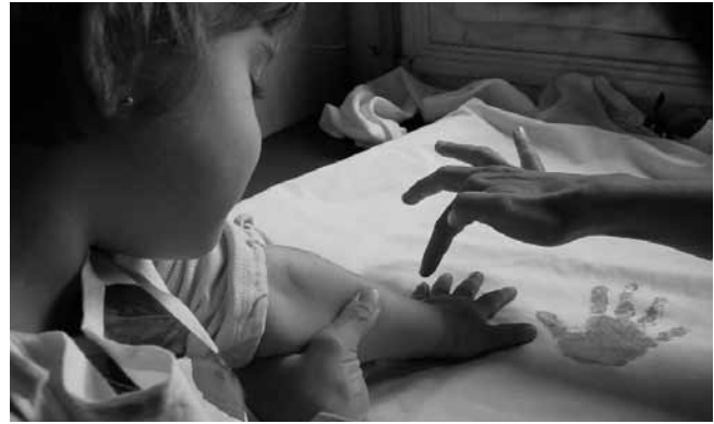
#6. Foto guanyadora del 1r Concurs de fotografia del CEESC. 2005. L'objectiu del premi: donar a conèixer el món de l'educació social a través de la fotografia.