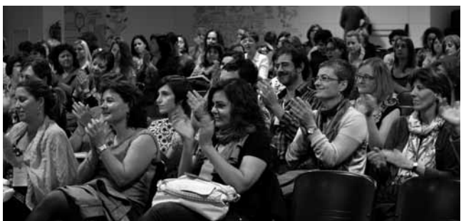
#17. Organitzem el primer Congrés de Serveis Socials Bàsics, conjuntament amb TSCAT i COPC. 2014. No fem sols el que podem fer amb altres.