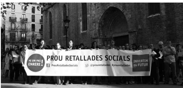
#11. Ens unim a la Plataforma Prou retallades. 2011. Una de les nostres finalitats: vetllar pels interessos professionals i els de les persones usuàries i consumidores.