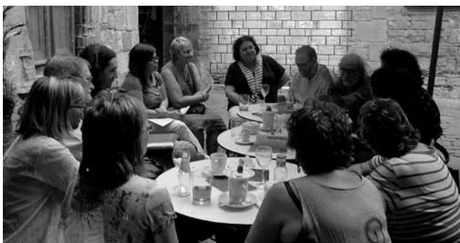
#13. Neix el projecte Sèniors. 2012. Per transmetre el llegat i el saber dels i les protagonistes que van construir la pràctica i la teoria de l'Educació Social a Catalunya als inicis.