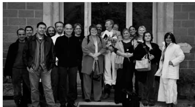
#4. Organització del II Simposi Europeu d'associacions professionals d'educadores i educadors socials a Barcelona: "La construcció de la plataforma comuna". 2004. Formem part de l'AIEJI des de 1999.