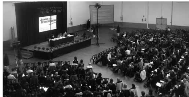
#10. Organitzem el 1r Congrés Català d'Educació Social a Vic, on ens reunim més de 450 professionals. 2009