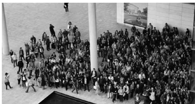
#14. Congrés Estatal d'Educació Social a València. 2012. El CEESC ha estat sempre molt present en la construcció Estatal a ASEDES i el CGEES.