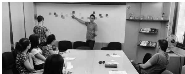
#20. Reunió de l'equip tècnic del CEESC preparant la celebració del 20è aniversari. 2016. Sempre hem disposat d'un equip que ha estat participant de la tasca del Col·legi