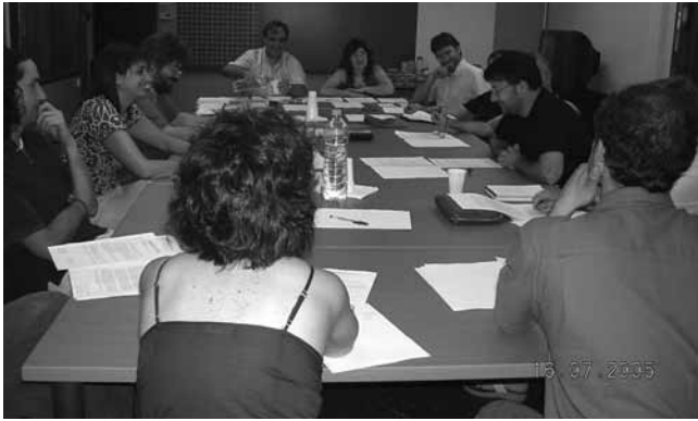
#5. Reunió de Junta de govern del CEESC. Traspàs de presidència. 2005. Durant aquests anys moltes col·legiades i col·legiats heu treballat per tirar endavant el CEESC.