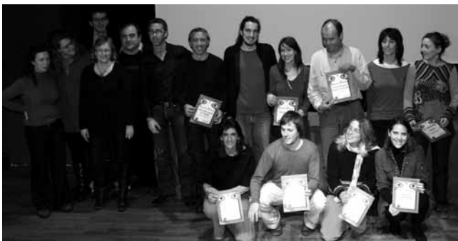
#9. Guanyadors del 1r Premi RetinES. 2008. Aquest any RetinES s'ha convertit en una comunitat web del món audiovisual des d'una òptica socioeducativa.