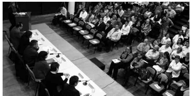
#8. Primera edició del Premi Quim Grau, del que aquest any presentem la 5à. 2008. El premi vol impulsar el treball de reflexió en el camp de l'Educació Social.