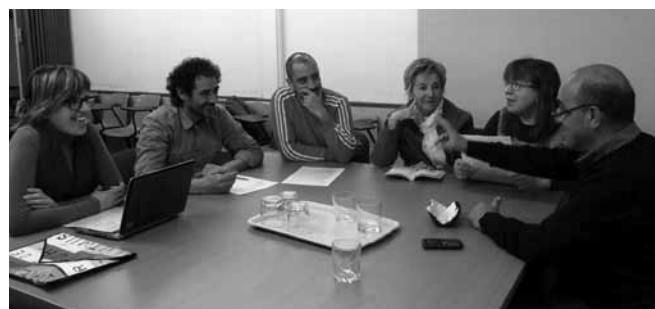
#12. Reunió del Col·lectiu professional de Mediació. El 1r col·lectiu creat al CEESC (1999). 2011. Els col·lectius professionals, una de les forces del CEESC.