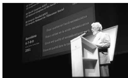
#2. El Congrés Mundial i Estatal d'Educació Social es celebra a Barcelona. 2001