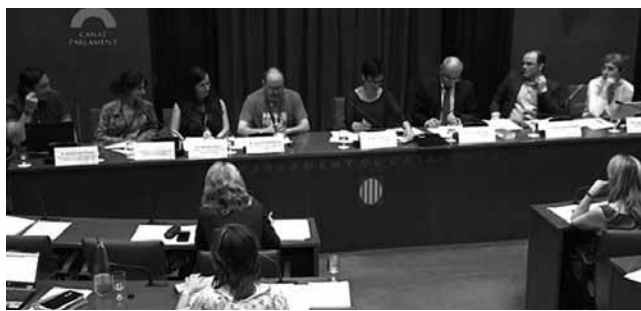
#18. Compareixença del CEESC davant la Comissió d'Igualtat de les Persones sobre les retallades en els serveis d'intervenció especialitzada en violència masclista. 2014. Fem sentir la veu de la professió en moltes institucions.