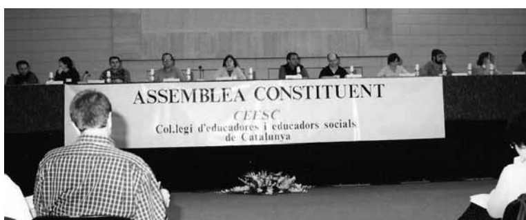
#1. Després de la publicació de la Llei de creació del CEESC el 1996 i del període de col·legiacions, es celebra l'Assemblea Constituent del CEESC al Palau Sant Jordi de Barcelona. 1998