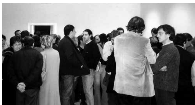
#3. Inaugurem la seu de Girona. 2002. Després van venir les de Tarragona i Lleida (2004) i la de Terres de l'Ebre (2011).