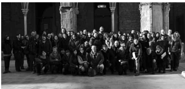
#15. 7es Jornades d'Infància i Educació Social. Aquest any celebrarem les 10es!. 2013. Sempre organitzades pel Col·lectiu d'Infància i Adolescència del CEESC.