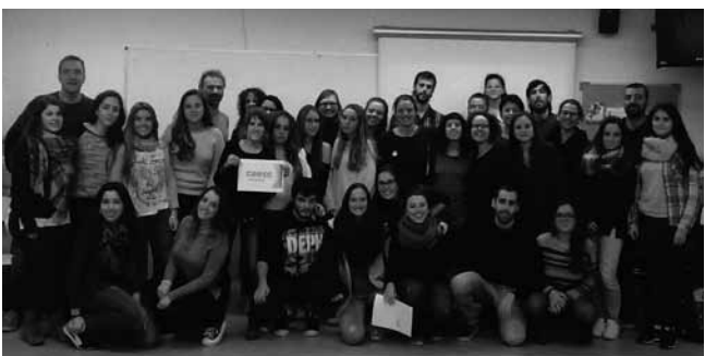
#19. Xerrada del CEESC a la UB. 2015. Acostar el món professional i l'universitari, una de les nostres lluites.