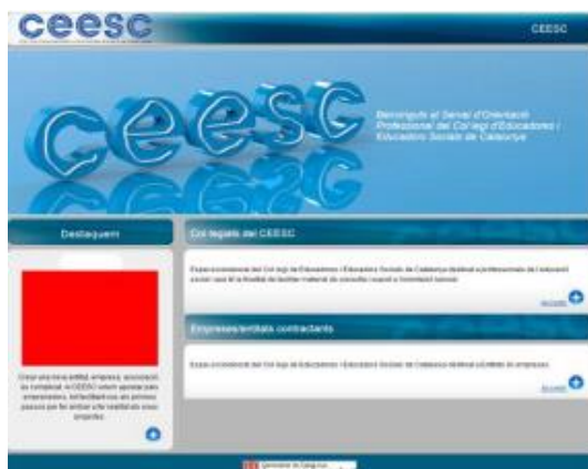
Borsa de Treball