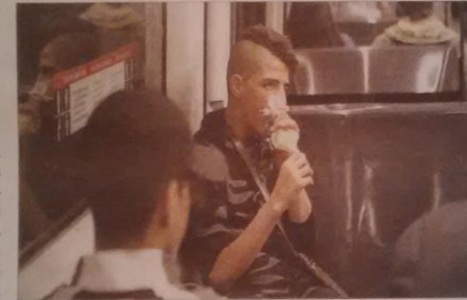
Un menor esnifa sustancias tóxicas en el metro.

El Sindic de Greuges, Rafael Ribó, denunció ayer el colapso en los centros de acogida de menores extranjeros no acompañados, los que llegan solos a Catalunya. La Conselleria d'Afers Socials calcula que cada mes recalcan en Catalunya unos 40 chavales procedentes, sobre todo, del norte de África. La Generalitat tutela a 3.000 chicos, el 22% de ellos, extranjeros. La consellera de Afers Socials, Dolors Bassa, ha admitido en reiteradas ocasiones que muchos de estos centros «están al límite de su capacidad, lo que implica menos servicios a los niños».