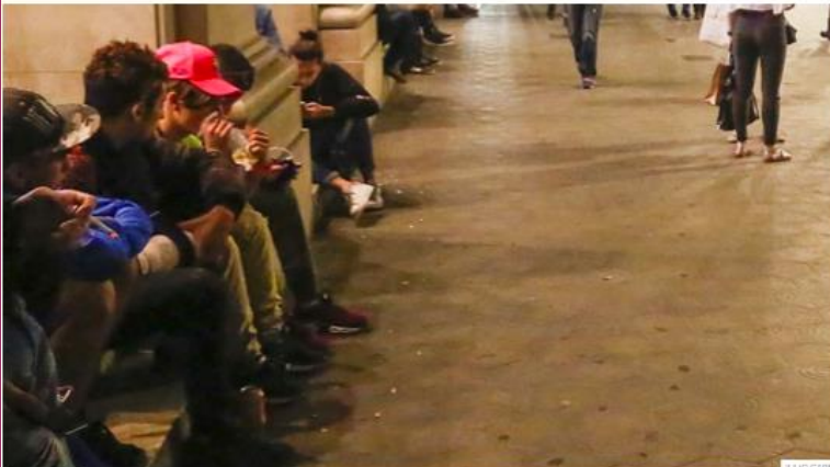
Un chico esnifa cola sentado en la parte exterior de la tienda Apple, en el paseo de Gràcia

Insta a C's a preguntar a sus colegas de Andalucía por qué muchos de estos menores llegan a Catalunya desde allí