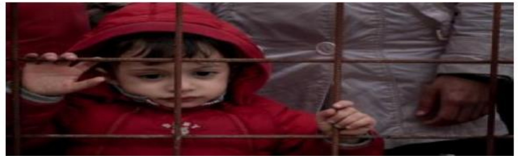
Para la Unicef, los 10 mil niños no acompañados desaparecidos en Europa confirma que estos niños se enfrentan a grandes peligros tratando de huir de la guerra en sus países.