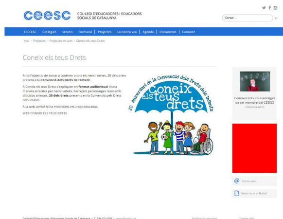
Pàgina interior web CEESC