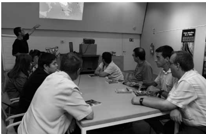
Club de Lectura Fàcil de la Biblioteca de Viladecans en col·laboració amb el Taller Ocupacional Caviga.

Els materials de Lectura Fàcil s'identifiquen amb el logotip LF, que atorga l'Associació Lectura Fàcil, un cop revisats i validats.