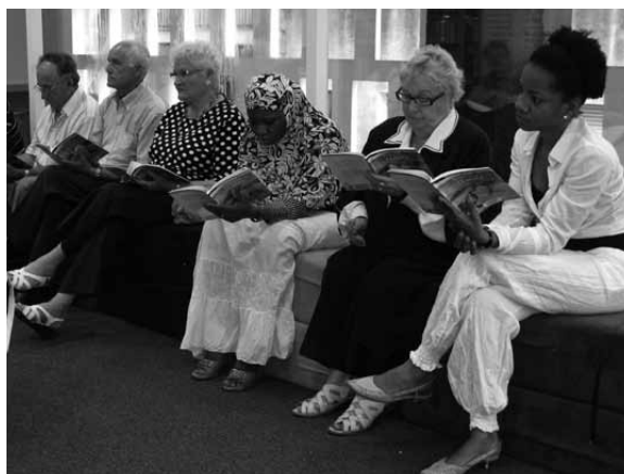
Club de Lectura Fàcil de la Biblioteca Mestre Martí Tauler de Rubí, amb població nouvinguda.