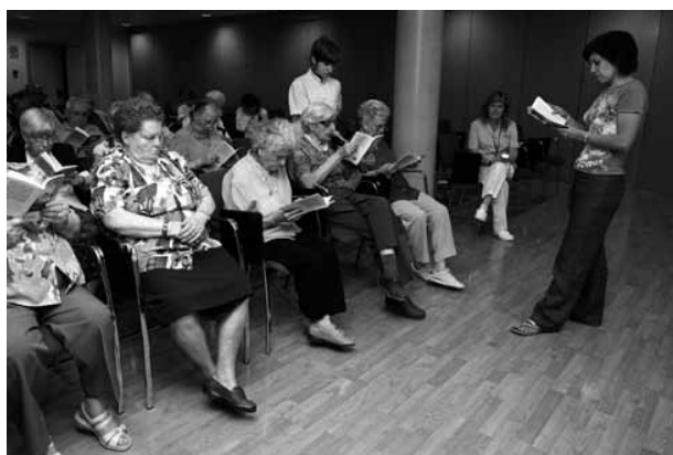
Club de Lectura Fàcil de l'Hospital de Dia de Manlleu en col·laboració amb la Biblioteca Bisbe Morgades.